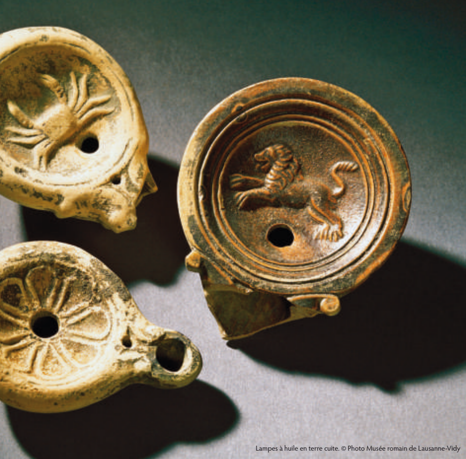
Lampes à huile en terre cuite.

Portuaire et marchande, Lousonna profite de sa position géographique à la croisée des grands axes routiers et fluviaux. Chargée du transport des marchandises sur le lac et de leur acheminement routier vers le port d'Eburodunum (Yverdon), la compagnie des bateliers du Léman y a son siège. Au forum, une vaste basilique témoigne de l'importance commerciale et administrative de la bourgade, qui déploie aussi une intense activité artisanale, notamment dans la métallurgie et la poterie.