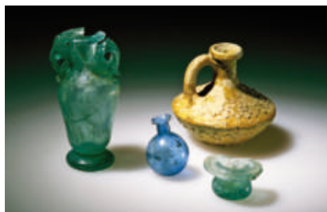
Fioles à parfum en terre cuite et en verre (le soufflage du verre, inventé au Proche-Orient, a été introduit dans nos régions à l'époque romaine).

introduites (vigne, noyer, châtaignier, ail, sarriette, betterave rouge, fenouil...), ainsi que de nouveaux animaux domestiques (chat,