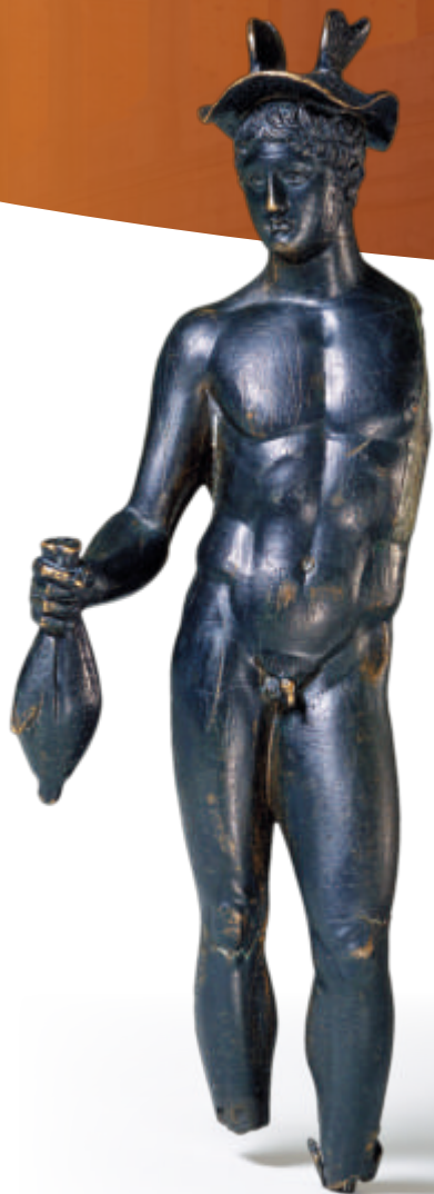
Statuette de Mercure. Le dieu du commerce, des voleurs, des voyages tient une bourse rebondie, symbole de prospérité commerciale.

De la fin du 1 er siècle avant au 5 e siècle après J.-C., la bourgade helvète de Lousonna s'étend sur la rive du Lacus Lemannus.