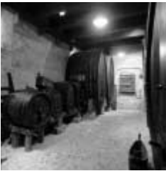
La cave Barradi

Quelques années plus tard, en 1804, la Commune d'Aigle acquiert le Château lors d'enchères publiques pour y abriter les prisons du district, le siège du tribunal, ainsi qu'un hôpital destiné à accueillir les familles pauvres. D'importantes transformations sont nécessaires pour faire face à ces fonctions et rendre l'édifice commode à sa destination nouvelle, qui perdurera jusqu'en 1972.