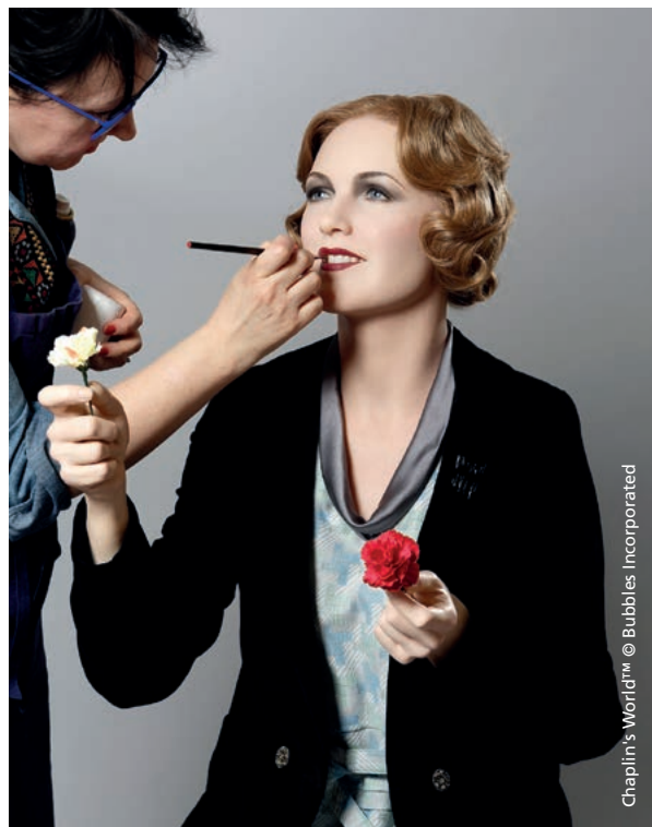
Chaplin's World™

Au total, ce sont plus de 200 journalistes qui ont sillonné la région pour découvrir ces nouveautés. A ceux-ci s'ajoutent bien entendu l'ensemble des agences, tour-opérateurs et autres professionnels du tourisme accueillis dans le canton, qui ont également pu visiter ces nouvelles infrastructures.