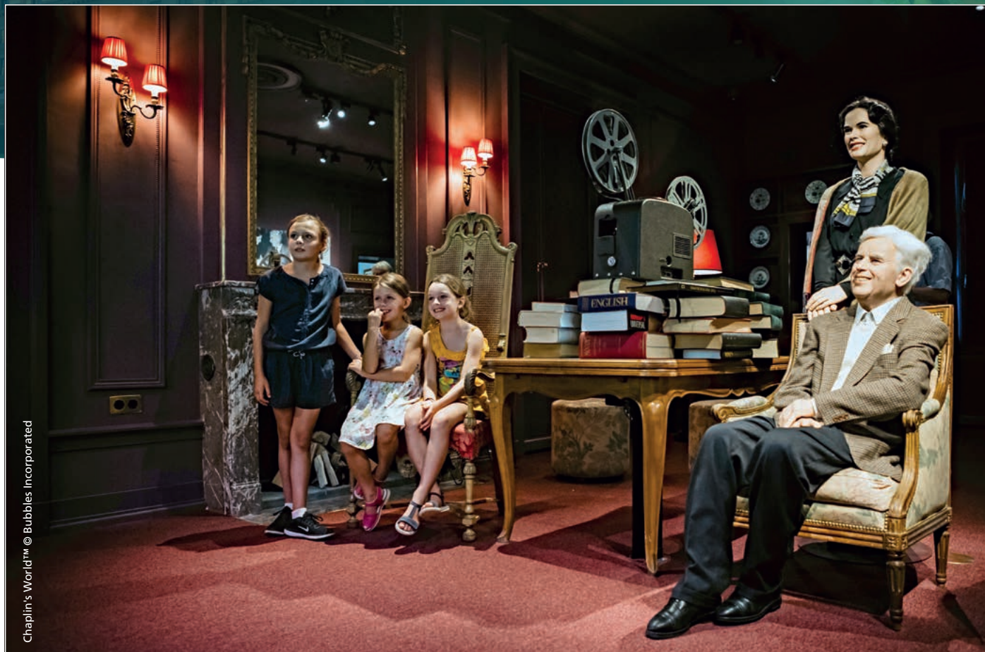
Chaplin's World™

En 2017, l'OTV poursuivra sa stratégie de diversification, centrée sur des thématiques précises, les Domaines d'Activités Stratégiques (DAS). Il coordonnera notamment deux campagnes de grande envergure à destination de la Suisse allemande. La première regroupera pour la troisième fois consécutive toutes les destinations