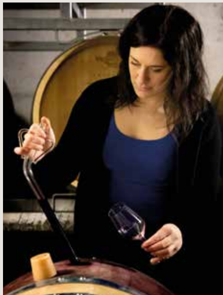
Dégustation en cave

Reprendre un domaine familial aujourd'hui, c'est donc à la fois un choix de cœur et un engagement pour l'avenir: celui de faire vivre un métier exigeant, profondément lié à notre terre, et de transmettre à notre tour ce patrimoine aux générations futures.