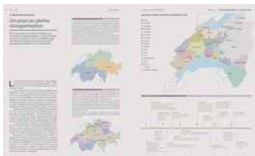
La République helvétique