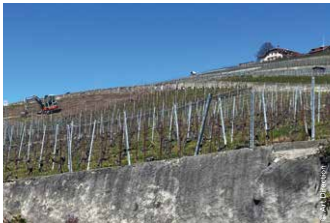
On arrache, on arrache...

À l'instar de tous les pays producteurs qui nous entourent, force est de constater que la surface viticole dépasse les besoins des consommateurs. Le redimensionnement du vignoble semble inéluctable.