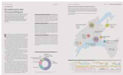
Les forces politiques

Prix de l'ouvrage: 54.- (au lieu de 64.-) à commander directement par mail à politique-histoire@bluewin.ch (mention prix spécial CDL)